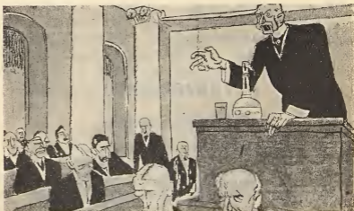
Рис. Б. Антоновского.